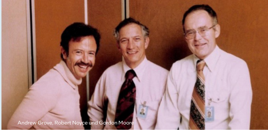
Andrew Grove, Robert Noyce und Gordon Moore

Es gibt keine Ausnahmen dafür mit Integrität zu handeln. Wenn Sie Fragen zur Anwendung des Kodex auf bestimmte Situationen haben, wenden Sie sich bitte an Ihren Vorgesetzten oder an andere Ressourcen, die in diesem Dokument beschrieben sind.